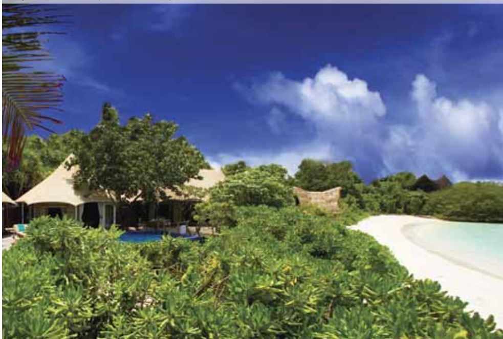
Banyan Tree Madivaru (Exterior View Villa)