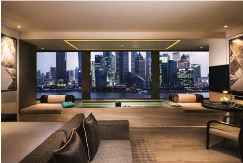
Banyan Tree Sanghai on the Bund (Panorama Oasis with Pool)