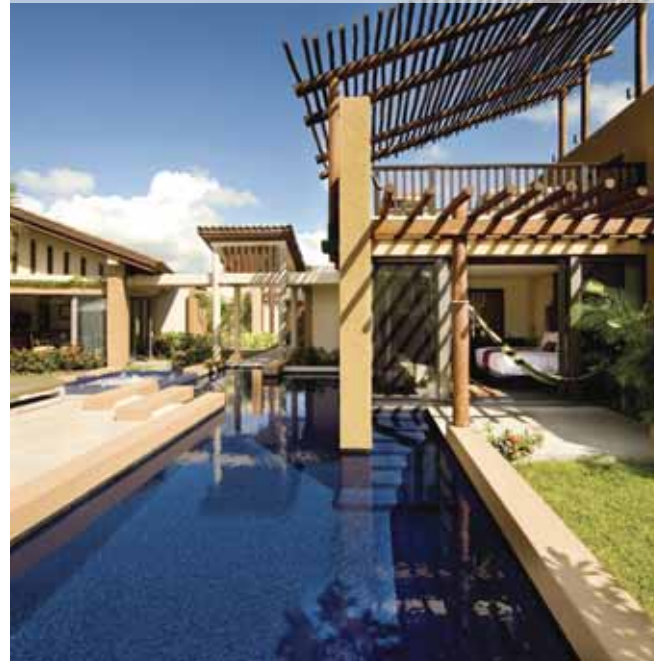
Banyan Tree Mayakoba (Spa Pool Villa)