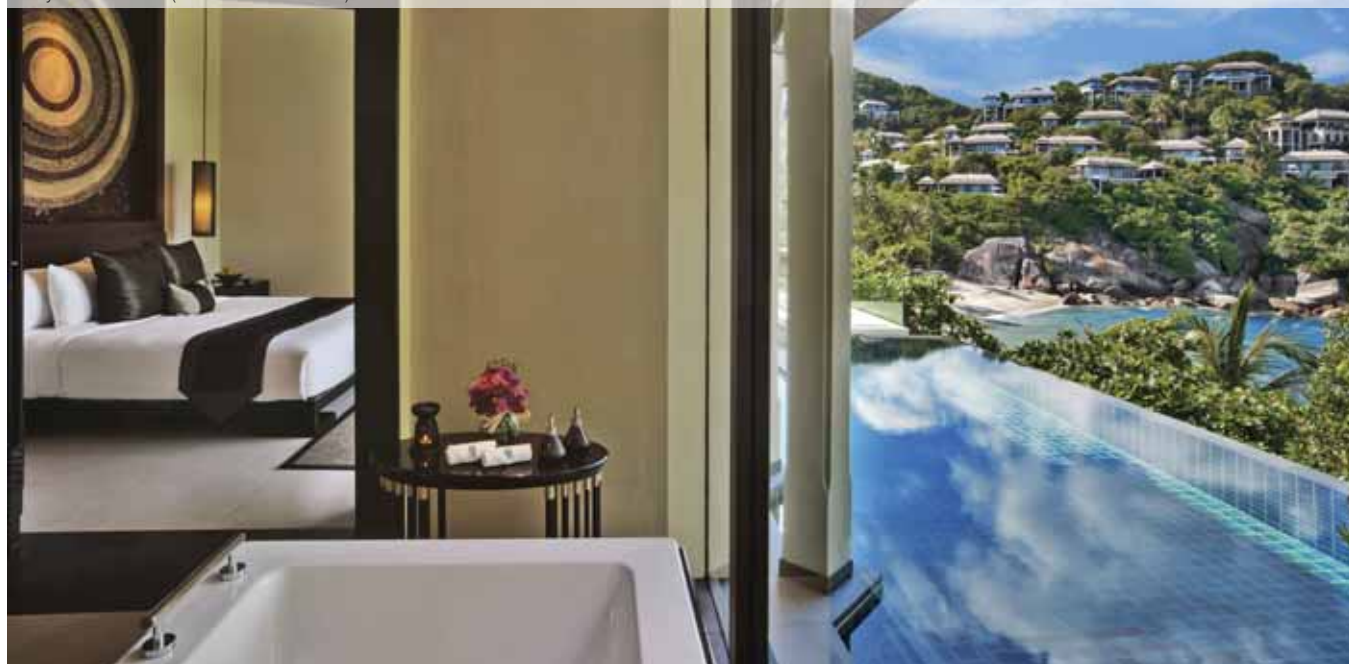
Banyan Tree Samui (Pool Villa Ocean View)