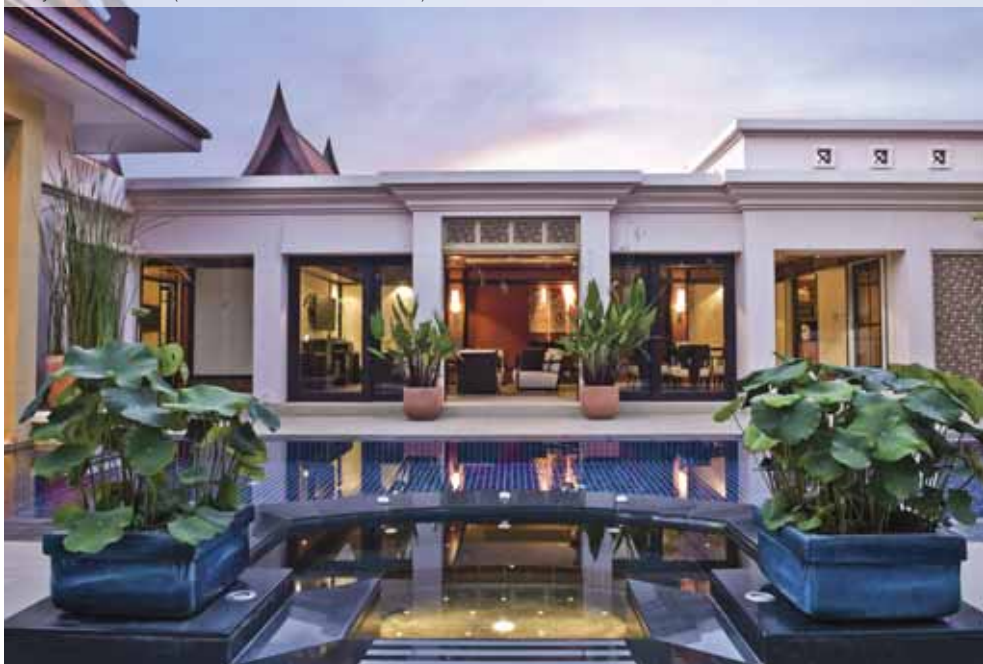
Banyan Tree Phuket (Deluxe Two Bedroom Pool Villa)