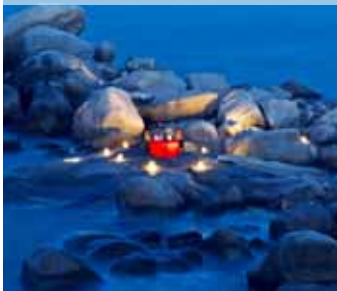
Banyan Tree Bintan (Dinner on the Rocks)