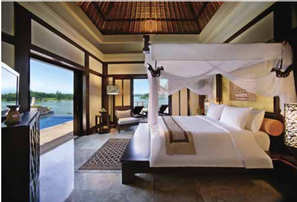
Banyan Tree Bintan (One Banyan Pool Villa)