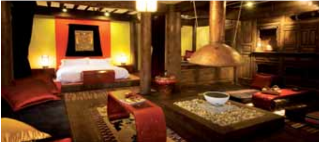
Banyan Tree Ringha