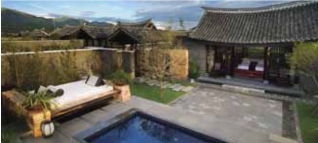
Banyan Tree Lijiang