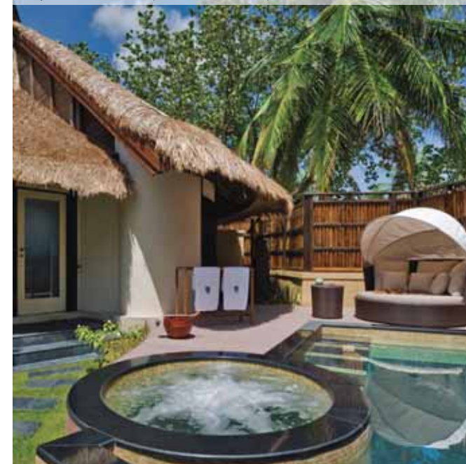
Banyan Tree Vabbinfaru (Beachfront Pool Villa)