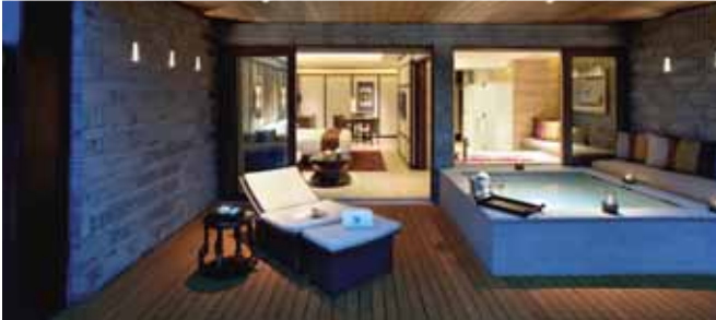
Banyan Tree Chongqing Beibei