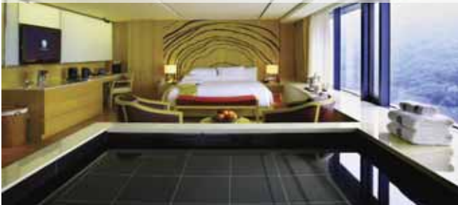
Banyan Tree Club & Spa Seoul