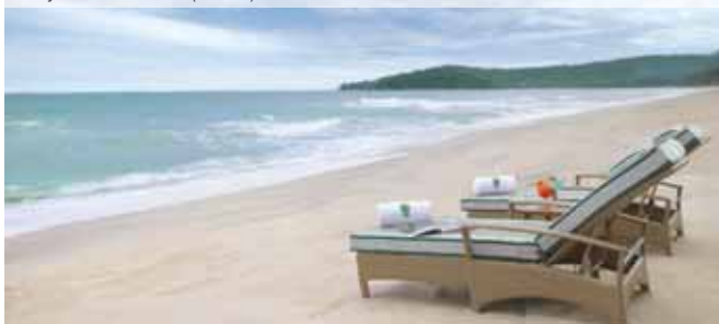
Banyan Tree Phuket (Beach)