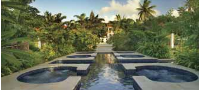
Banyan Tree Sanya