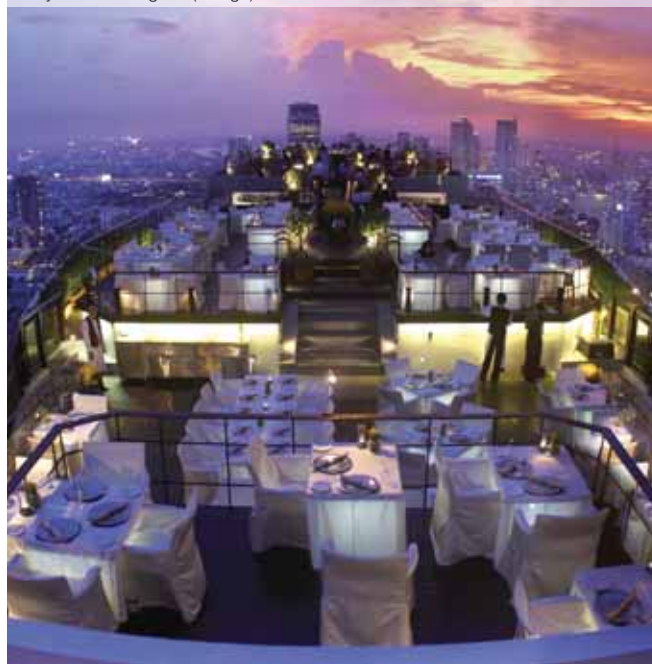
Banyan Tree Bangkok (Vertigo)