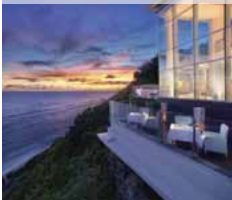
Banyan Tree Ungasan (Ju-Ma-Na Rest.)