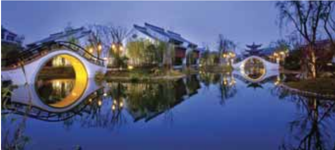
Banyan Tree Hangzhou