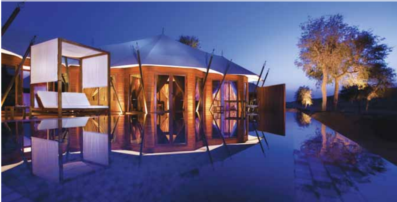
Banyan Tree Al Wadi (Al Khaimah Villa-Pool)