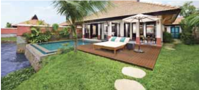
Banyan Tree Kerala