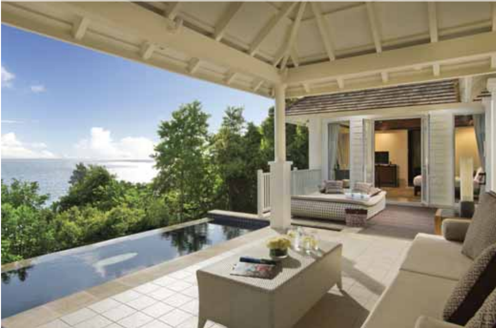
Banyan Tree Seychelles (Hillside Pool Villa)