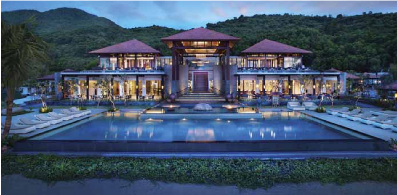
Banyan Tree Lăng Cô (First Overview Sunset)