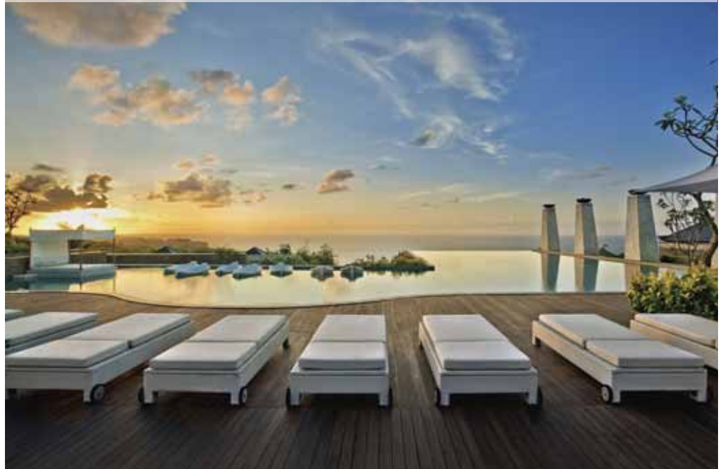
Banyan Tree Ungasan, Bali (Infinity Pool)