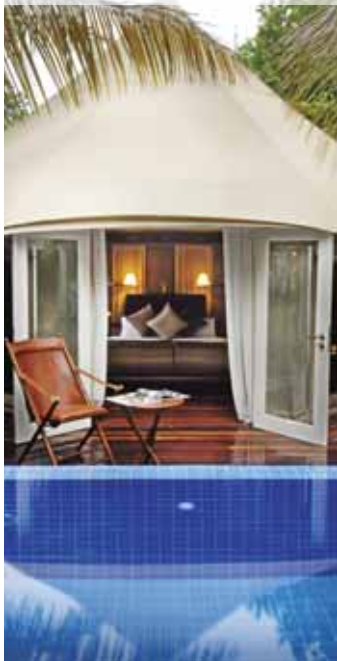
Banyan Tree Madivaru (Tent)