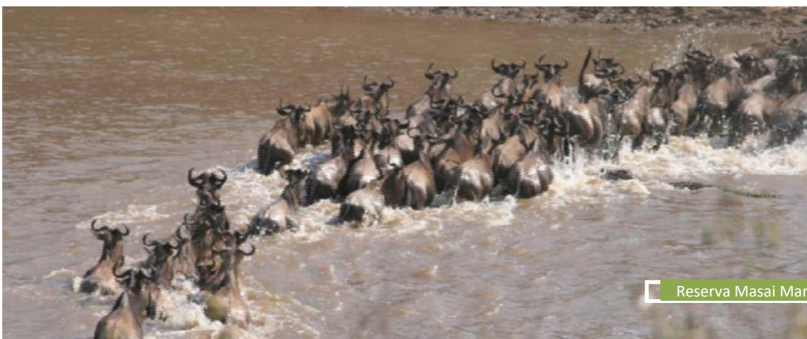
Reserva Masai Mara

Durante nuestra estancia en Masai Mara, realizaremos 2 noches de acampada libre en lugares totalmente salvajes, rodeados de los sonidos nocturnos que emite la sabana africana. Aprovecharemos mucho las primeras horas de sol, así como las últimas, para poder ver a los animales del Mara en su plena actividad y, si tenemos suerte, el siempre difícil de avistar cruce del río Mara de la gran migración.