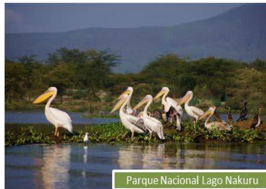
Parque Nacional Lago Nakuru